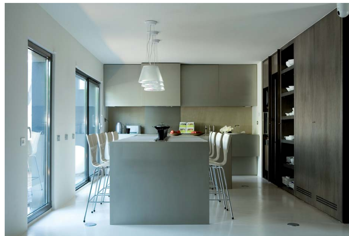
the muted colour scheme is used to extend the sence of space / la paleta de colores neutros utilizada extiende la sensación de espacio.