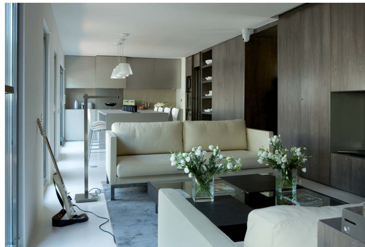
the linear configuration of the space is divided into discrete zones / la configuración lineal del espacio se divide en zonas discretas.

Para los clientes, la seguridad era también una importante cuestión a considerar dada la ocupación periódica, con un total de 6 barreras de defensa, incluidos sensores de movimiento, cámaras infrarrojas y alarmas de conexión dual.