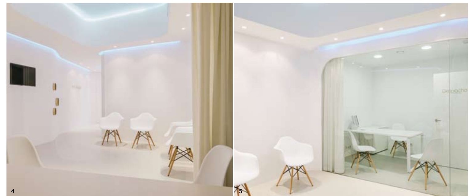
1 y 2/El trazado sinuoso de armarios y tabiques de Knauff invita a recorrer el interior. 3/La recepción se orienta a la calle. 4 y 5/La iluminación por LEDs destaca la volumetría de los techos.