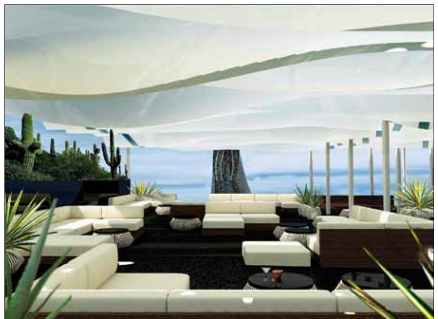
Cocon chic, la terrasse du restaurant Arola de l'Hotel Arts et ses banquettes tournées vers la mer.