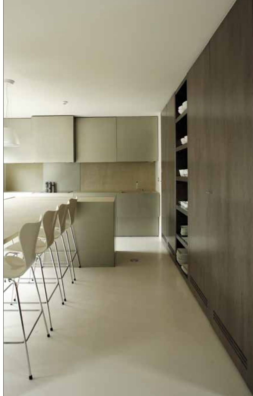
Pour le Penthouse de la Place de Catalogne, les architectes ont opté pour des tons crème et moka, doux acteurs d'un confort immédiat.