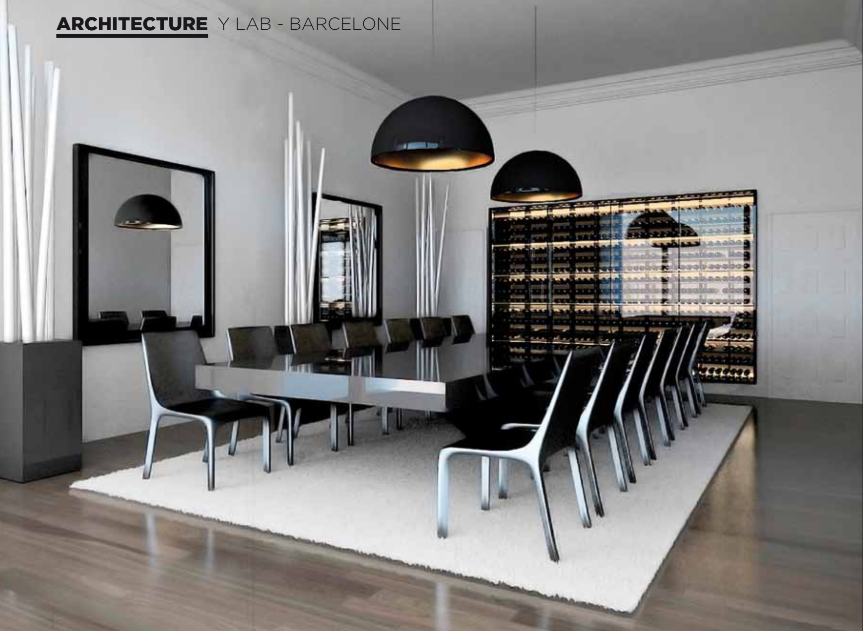
Blanc, et noir, la salle à manger de l'appartement du Turo Parc est un très bel exemple de fonctionnalisme maîtrisé.

Changement de ton, de matériau mais aussi de lumières, pour accentuer le passage dans un autre univers, un autre lieu... Comme une autre dimension, on pénètre ainsi de salons en cuisine en vivant une expérience visuelle et sensorielle. Des gimmicks qui marchent donc et permettent d'injecter une véritable énergie dans la reformulation des habitations, en leur octroyant une identité plus forte. Une énergie que l'on retrouve aussi dans le Penthouse situé sur la plaza de Catalunya, en plein cœur de la ville.