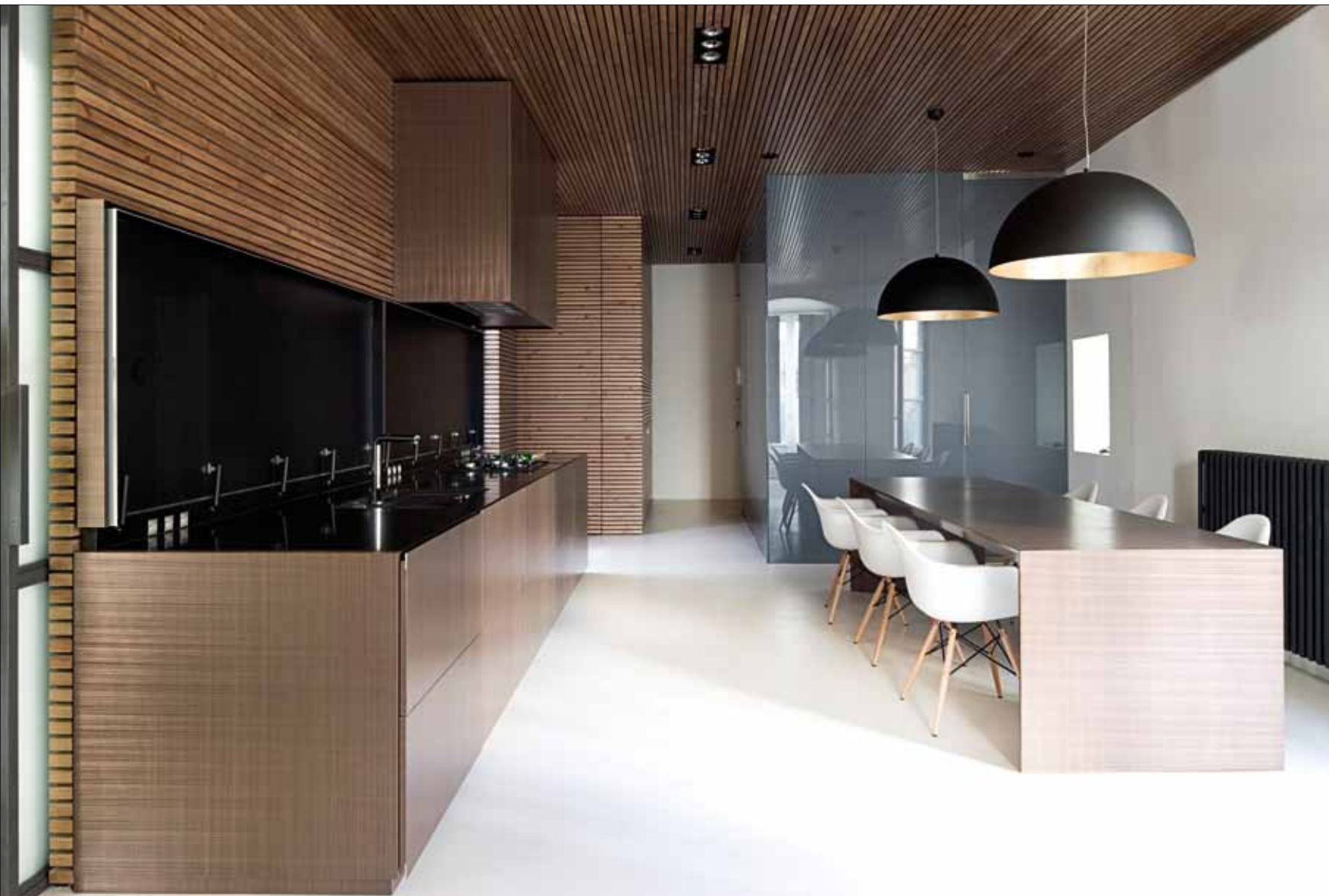
Dans la cuisine de l'appartement, les architectes ont fait le choix de l'épure et des tons et matières naturels.

Les fenêtres sont agrandies, les conduits qui mènent vers l'extérieur élargis, le salon et la cuisine reprennent le dessus. Dedans, dehors, la maison reprend son rôle d'habitation. Du XXI ème siècle.