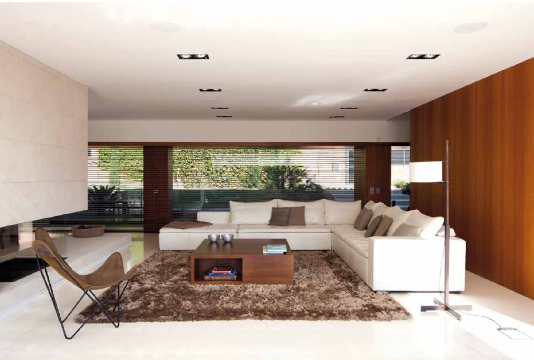
Dans le salon des tons doux et naturels qui permettent de vivre l'espace en toute aisance et simplicité.