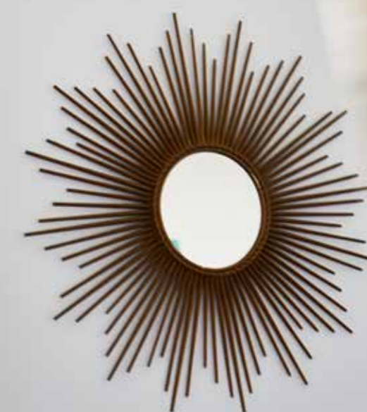
Coloca un espejo sol en el tiro de una chimenea, un rincón de la escalera o el recibidor: su gran tamaño aportará un nota muy sofisticada.