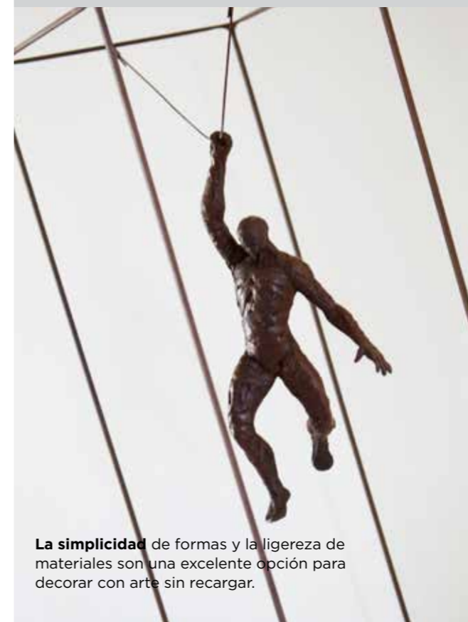
La simplicidad de formas y la ligereza de materiales son una excelente opción para decorar con arte sin recargar.

Las piezas de anticuario, las vintage y el arte se convierten en un nexo de unión entre la arquitectura y el interiorismo: favorecen la excelencia, la calidad y el detalle y ayudan a crear espacios cálidos y contemporáneos. Además son elementos ideales para combinar con estructuras de porte clásico, como los suelos de mosaico hidráulico, los rosetones y las molduras. Atrévete con pequeñas piezas, en muros o pedestales y deja que llenen el espacio de sofisticación. No son necesarias grandes obras (pintura, escultura...), pero sí bien seleccionadas.