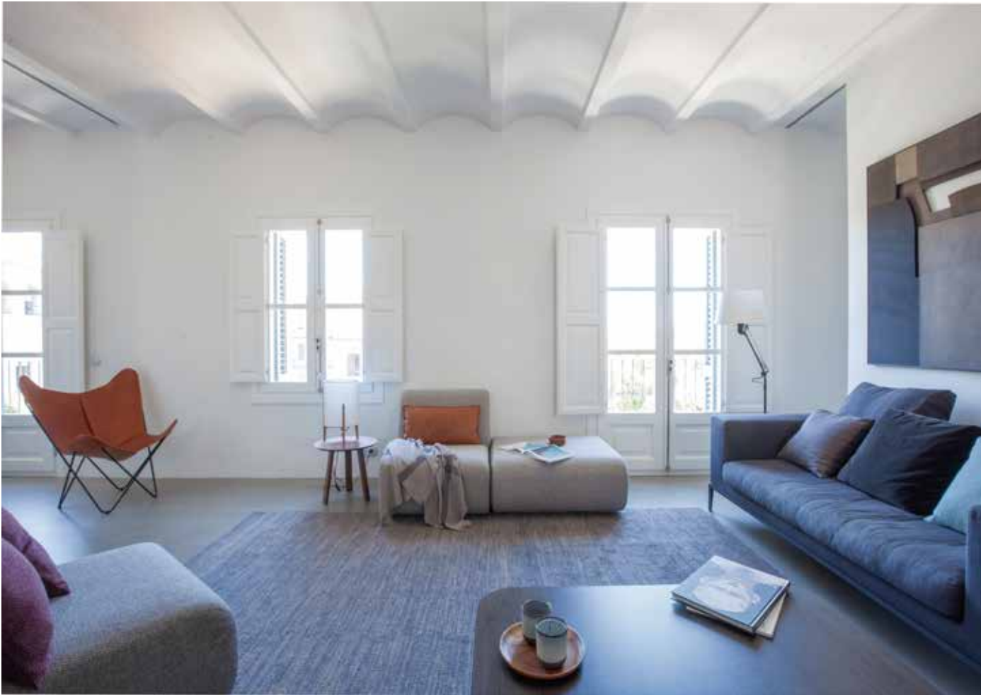
TEXTOS: ADA MARQUÉS.